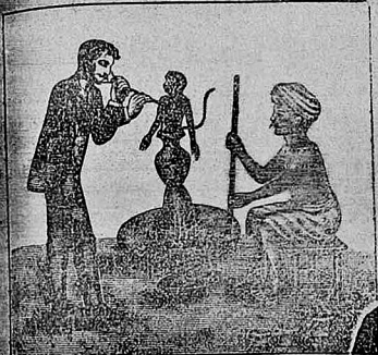
ননপ্তশ্বে, ননপ্তশ্বে ননপ্তশ্বে নমো নমো।

যো বীৰ: কৃত্ত চক্ৰাং তু কপিৰূপেণ সস্তুঃ।