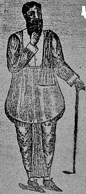
কলপ লগোৰাৰ পিছত

UNIQUE HAIR DYE (INSTANTANEOUS) Wonderful Discovery for Blackening the White, Red or Grey Hair. Once Tried Always Used, The dyed hair is no affected by washing in soap and water.