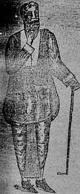
কলপ লগোৰাৰ আৰ্ণেগে