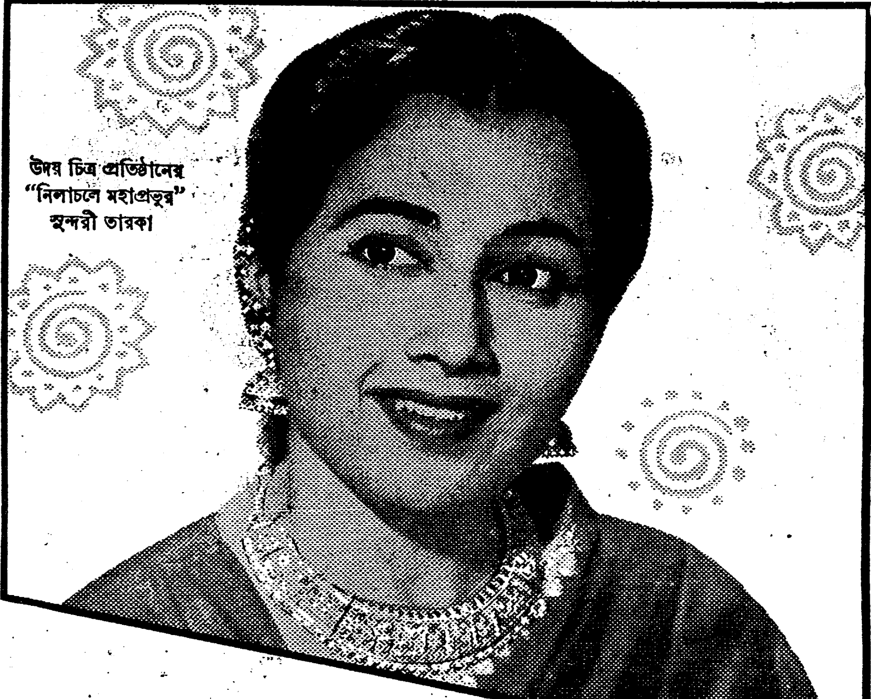
উপর চিত্র প্রতিষ্ঠানের "নিলাচলে মহাপ্রভুর" হৃদয়ী তারকা

মিডা'র গোয়াজা জেলি, টোম্যাটো সস, আমেরি, চাটনি, ভিনিগার, সর্ষপ্রকার তৈল সংযুক্ত ফলের আচার, ফলের কোয়াস ও সিরাপ, মাংস রাধিবার উৎকৃষ্ট কাঁচি পাউডার ইত্যাদি। প্রস্তুতকারী ও রপ্তানীকারক মিডা এন্ড কোম্পানী প্রাইভেট লিমিটেড, ৩০, ক্যানিং স্ট্রীট, কলিকাতা-১ (ফোন: ২২-৬৫)