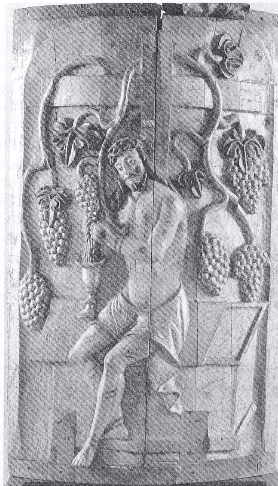
[5. Chrystus Eucharystyczny , Kościół Bożego Ciała, Kraków (fot. Ewa Kubiak); Museo Nacional de Charcas, La Paz (fot. Ewa Kubiak)]