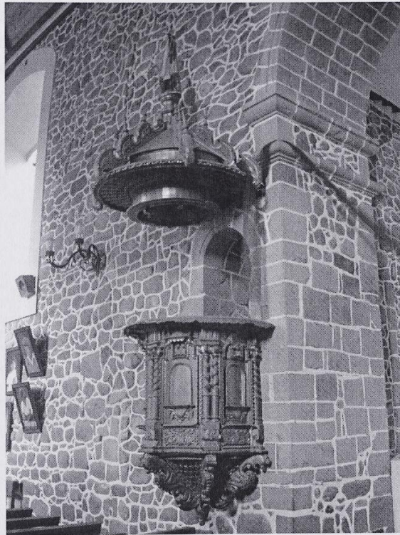
[Fig. 7. Pulpito de Yunguyo.]

columnas encontramos modillones adornados con una máscara vegetal. Probablemente, haya tenido respaldo. El tornavoz piramidal, agallonado y rematado por un santo, tiene en su parte inferior también agallones que parten de una flor.