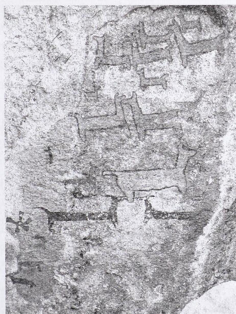
[Fig. 28. Sector en el extremo derecho del gran panel de M4 con multitud de camélidos de estilo variado.]