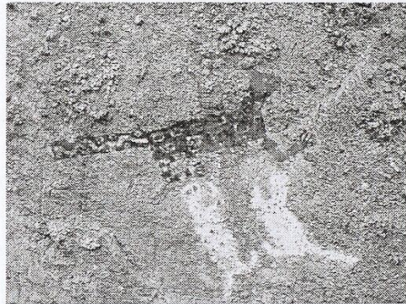
[Fig. 34. Jaguar con dos cachorros Foto tratada con D'Stretch, canal "lds".]