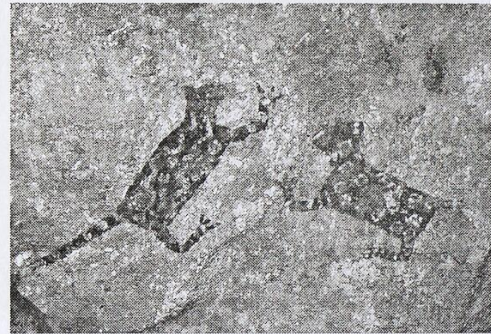
[Fig. 35. Dos jaguares en movimiento. Foto tratada con D'Stretch, canal "lab".]