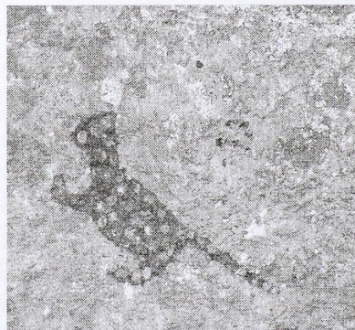
[Fig. 36. Dos cachorros de jaguar.]