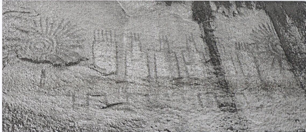
[Fig. 63a. Panel de Intipintasqa, comunidad campesina de Cachín. Foto tratada con DStretch-ImageJ, canal de color "Ids" (Foto: Cortesía Jorge Ochoa).]