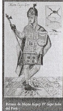
[Fig. 67. Unku con tokapu de los cuatro cuadrados. Dibujo de Martín de Murúa.]