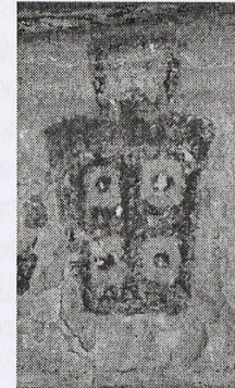
[Fig. 69. Personaje con túnica trapezoidal, Alero de la Rinconada de Santa Bárbara (Foto: Cortesía Marco Arenas).]