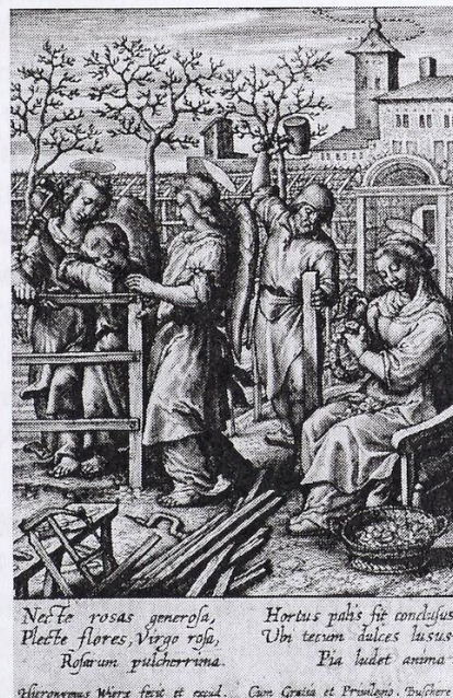
[Fig. 11. Necte rosas generosa . Hieronymus Wierix, primeros años del siglo XVII, anterior a 1613.]

Ambas pinturas pertenecen a la escuela de los Wierix desde lo iconográfico y desde la invención compositiva. No obstante, desde lo estilístico, el Nº de catálogo INC 81 es atribuible a la escuela barroca collavina y fechable entre la segunda mitad del siglo XVII y el siglo XVIII, mientras que el Nº de catálogo INC 90, en cambio, es de escuela cuzqueña y cronológicamente su datación se circunscribe al siglo XVIII. Esta última - lamentablemente en muy mal estado -, por su carácter mestizo está más alejada de las leyes ópticas, generando ciertos aplanamientos de los volúmenes y el espacio está organizado por segregación de planos. Por su parte, en la tela collavina se respetan ciertas normas persépticas básicas, aunque las mismas no se ajustan de modo completo a la óptica. La escena invernal del modelo gráfico, se translitera en la pintura colla-