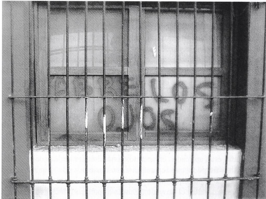
[Fig. 8. Letrero pintado en una de las ventanas “Abre los ojos” (Fot. J. Kotarski).]