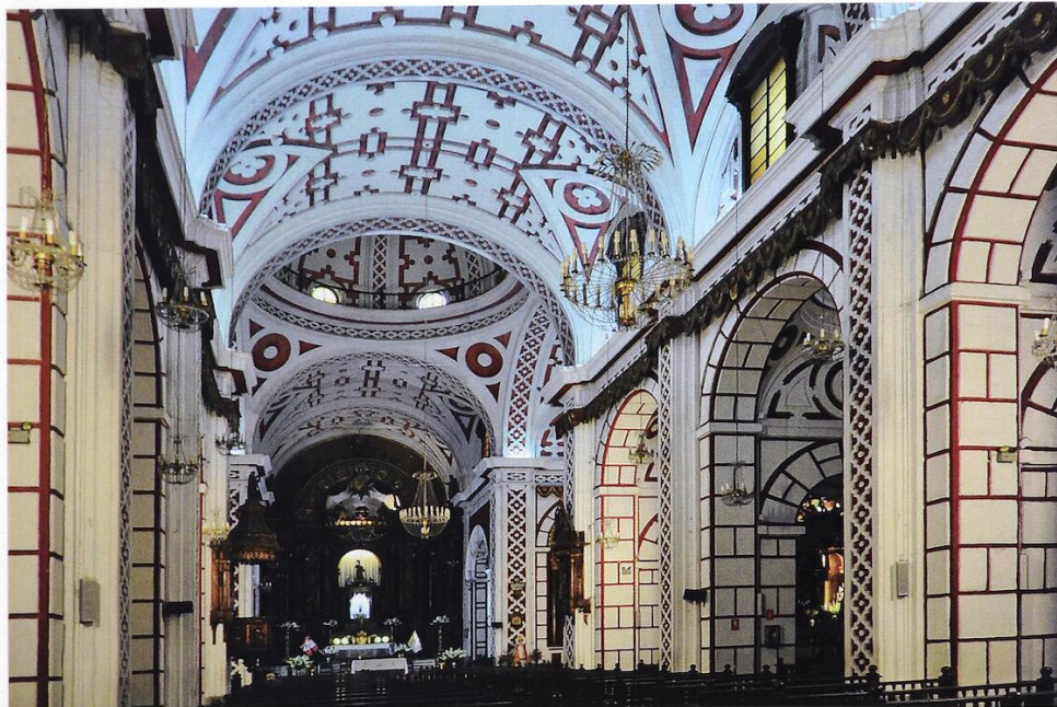
Fig. 5. San Francisco, el interior de la iglesia de, después del 1673 Lima, Perú