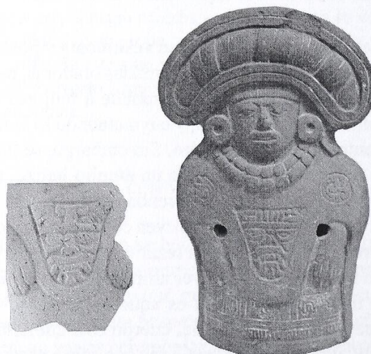
[Fig. 14. Fragmento de figurilla de mujer con una prenda como capa o quechquemil que tiene como decoración en la parte frontal la representación de Tláloc, pertenece al Proyecto Arqueológico Comalcalco. A un lado una figurilla completa del Museo de Hecelchakan, Campeche con el mismo atuendo y diseño iconográfico.]