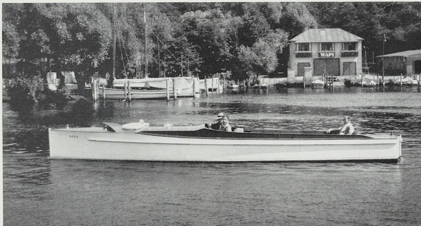
Nr. 381. Auto-Boot, 6 Zyl., 12 mtr. Stahlkörper, guter Zustand. N. A. G.-Motor