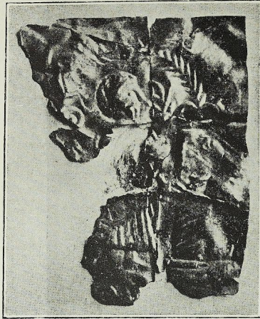
19-20: τεμάχια μεταλλικῆς ἐπενδύσεως ξυλίνης πυξίδος.

Τὰ γράμματα ἔνεκα συνθλίψεως καὶ φθορᾶς τοῦ μετάλλου εἶνε δυσδιάγνωστα. Διέκρινα τὰ ἑξῆς: