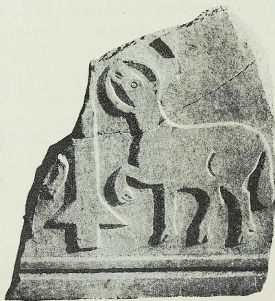
1: προσθία ὄψις.

ἄνθη, φυτὰ, σταυροί, κύκλοι, ἀστέρες κλπ. Ἐπειδὴ δ' ἔνεκα τῆς μεγάλης καταστροφῆς τούτου κατέστη ἡμῖν ἀδύνατος οἰαδῆποτε συναρμολόγησις, διὰ τοῦτο θέλομεν περιγράψαι τὰ μεγαλύτερα τὸ σχῆμα καὶ σπουδαιότερον ἅμα τῶν τεμαχίων τούτων. Καὶ ἐν πρώτοις τὸ ἄριστον ἀπάντων (μήκους 0,54 ὄψ. 0,59 πλάγ. 0,07-8) εἶνε τὸ ἐν εἰκ. 1 καὶ 2 πρὸς δεξιὰν μέγα ἀνάγλυφον ἐκ δύο τεμαχίων ἀποτελούμενον, ἐπὶ τῆς κυρίας ὄψεως τοῦ ὁποῦ παρίσταται ἀμνὸς ἐστραμμένος ἐν κατατομῇ πρὸς τὰριστερὰ καὶ βαδίζων πρὸς τὸ κάθετον σκέλος σταυροῦ, οὗ παρὰ τὴν βάσιν ὕψοι τὸν ἕνα τῶν προσθίων ποδῶν. Ὁ ἀμνὸς οὗτος ἀνέχει τὴν κεφαλὴν πρὸς τᾶνω, ἔχει δ' ἐστεμμένην ταύτην διὰ τροχοειδοῦς ἄλω, τοῦ χριστιανικοῦ φωτοστεφάνου, ἐξ οὗ δηλοῦται ὅτι πρόκειται περὶ τῆς συμβολικῆς παραστάσεως αὐτοῦ τοῦ Σωτῆρος ἡμῶν Ἰησοῦ Χριστοῦ. Λίαν χαρακτηριστικὴ εἶνε ἡ πρωτογε-