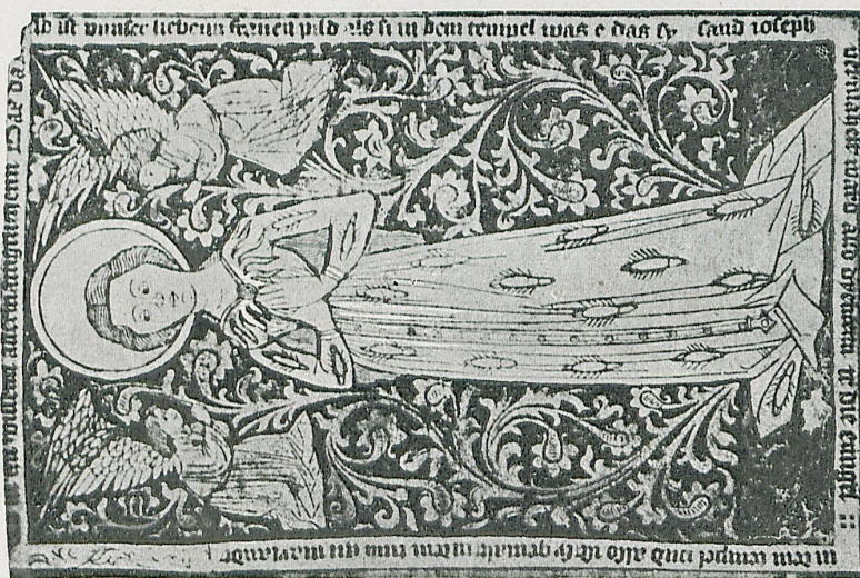
München: Holzschnit in der Hgl. Hof- und Staatsbibliothek, ca. 1450—1460.