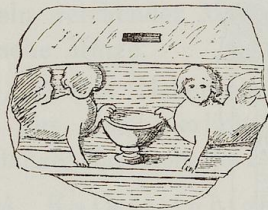
Fig. 24. Sphingen.

99. Desgleichen; in Form und Darstellung identisch. Der Stein ist oben und hinten abgeschlagen. Die Seitenflächen beschuppt. Höhe 44 cm. Grundriss 36 : 22 cm.