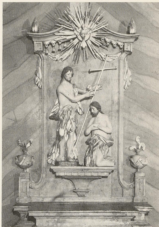
9. Kazateľnica vo Višňovom z r. 1796.