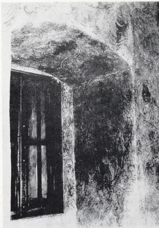
17. Orava — hrad, ostenie okenného výklenku na východnej stene 2. poschodia donjonu, 1480—1483