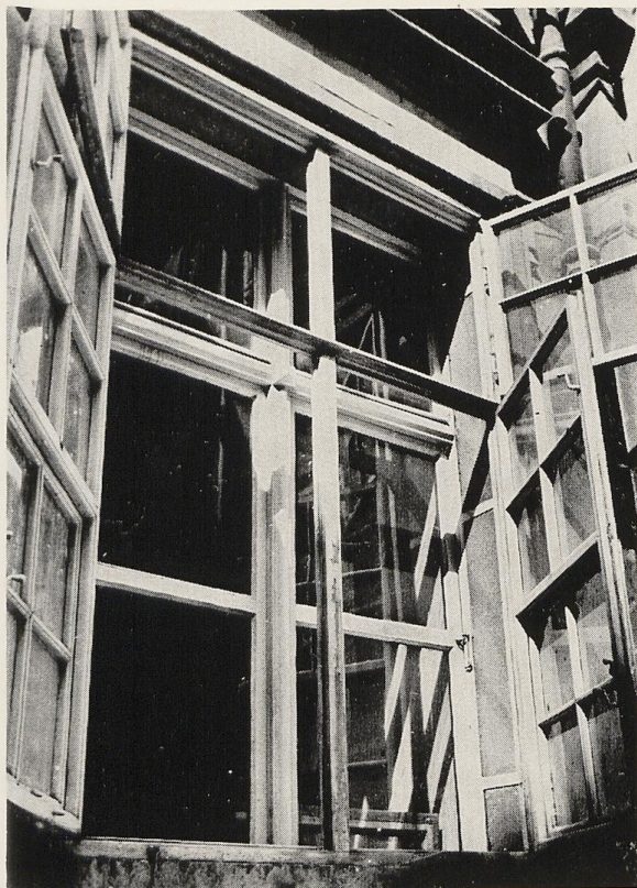
Bratislava, Primaciálny palác, okno na prízemí, nádvorie (1777–1781).