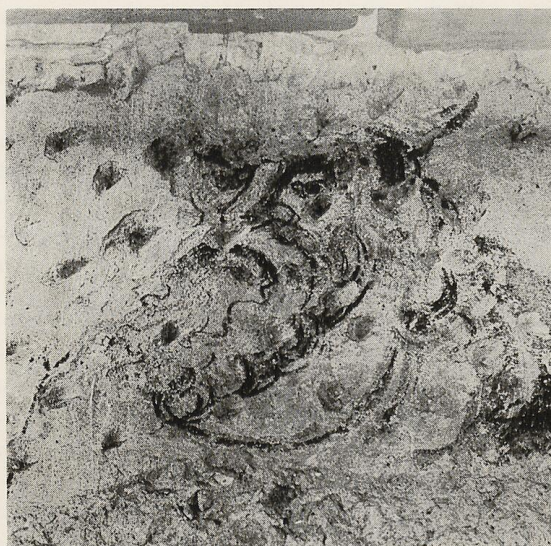
Neznámy svätec v piatom poli, detail.

statnej budovy, na ktorý je tu opäť dostatočne veľká, dnes však deštruovaná plocha v pravej časti poľa — postava je posunutá doľava. V hornej časti uzaviera obrazovú plochu segmentový pásový oblúk v niekoľ-