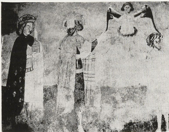
Postavy troch kráľov z príbehu Klaňania sa.

ve, ktorému predchádzal rozsiahly prieskum, priniesol nové fakty, ktoré čiastočne menia, ale najmä spresňujú našu predstavu o rozvoji monumentálnej maľby v oblasti Gemera. Archeologický výskum spresnil možné datovanie stavby, čo má zasa značný význam pre poznanie rozvo-