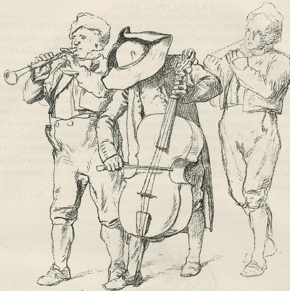
DESSIN DE GUSTAVE BRION. Étude d'après nature pour son tableau « Une Noce en Alsace ». (Collection de M. Auguste Herlin.)