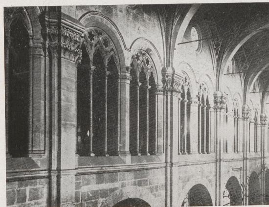
Fig. 2 — Decorazione interna del San Martino di Lucca.

del duomo, e continua la fioritura ornamentale sino all'avvento di Jacopo della Quercia, ultimo a raccogliere le antiche agitate forme per infondere in esse nuova tempra ferrea