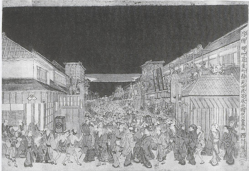
5. Utagawa Toyoharu, Widok teatru w Edo tuż przed rozpoczęciem kaomise , Tokio, Muzeum Narodowe, repr. za: T. T. Clark, Osamu Ueda, The Actor's Image. Print Makers of the Katsukawa School , Chicago 1994, il. 7