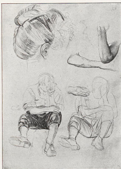
MAX KLINGER—LEIPZIG. Studie zum Blatte »Elend«.

NOTIZ. Zu unserem X. Wettbewerbe (Amateur- und Künstler-Photographie) ist ein weiblicher Studienkopf eingegangen ohne Motto und ohne Rücksende-Adresse. Bildgröße ca. 45 : 30 cm in weisses Passepartout eingefügt. Da diese Photographie durch einen Preis ausgezeichnet wurde, bitten wir den Urheber, sich alsbald unter Angabe seiner Adresse auszuweisen! — Die Entscheidung des Preisgerichtes werden wir unter Abbildung der preisgekrönten Entwürfe mit anderen Wettbewerb-Entscheidungen im Dezember-Hefte veröffentlichen. D. RED.