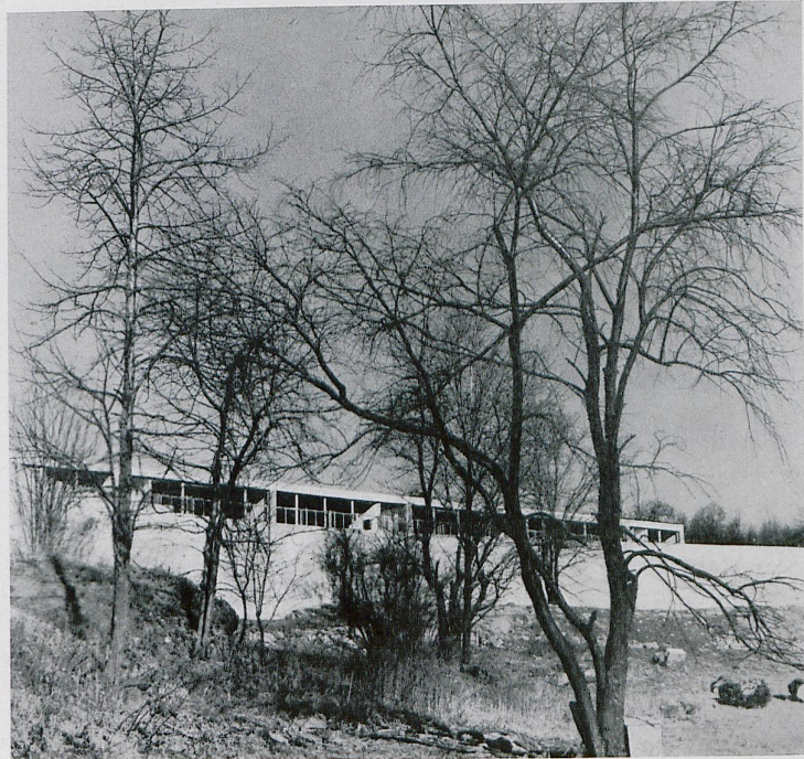
Die Hessian-Hills-Schule in Croton am Hudson, Staat New York. Architekten Howe und Lescaze, New York und Philadelphia