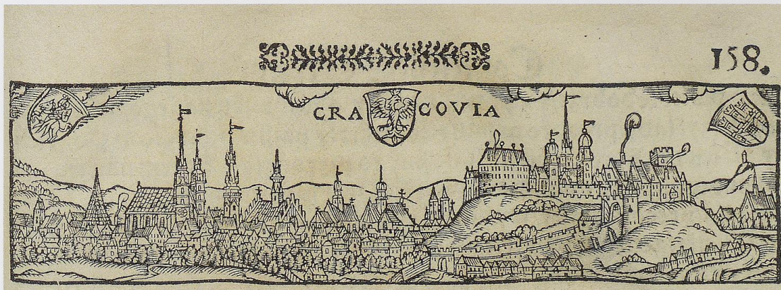
4. Widok Krakowa od północnego zachodu, drzeworyt, użyty jako winieta na s. 158 w druku z oficyny Mikołaja Szarfenbergera Constitutie, statuta i przywileje na walnych sejmiech koronnych od roku 1550 aż do roku 1581 uchwalone ; Biblioteka Jagiellońska