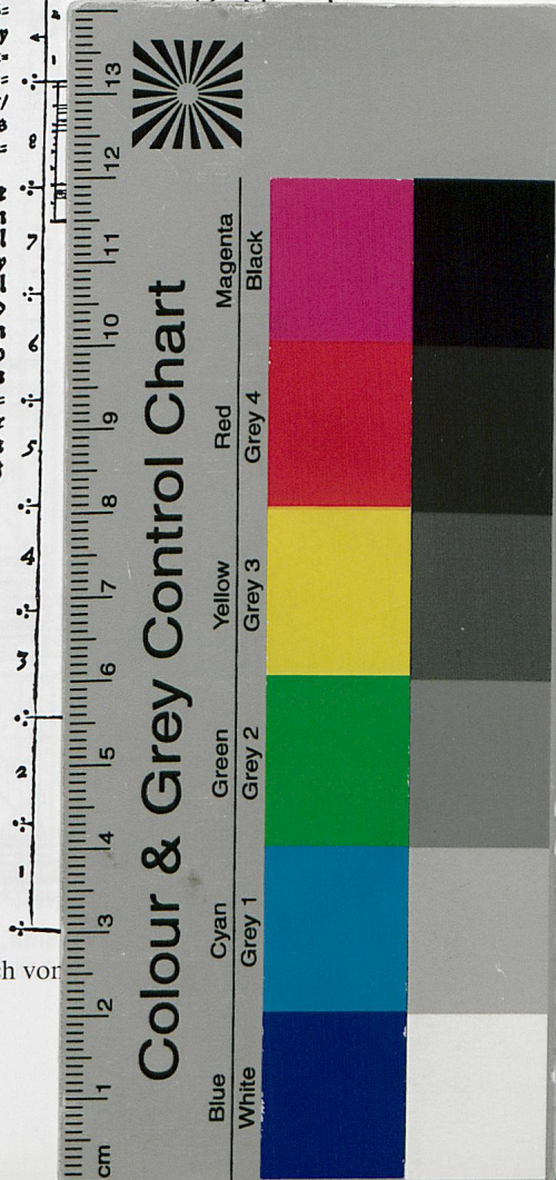
Abb. 3 Hans Blum, Die Supraposition. „Buch vor