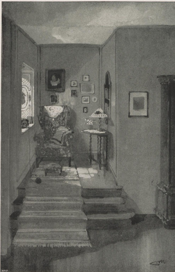
RATH & BALBACH-KÖLN. ENTWURF CARL MÖLLER. NISCHE IN EINER DIELE

Es muß zugegeben werden, daß Amerika durch die wirtschaftlich günstige Lage einen Vorsprung in der »Entwicklung« uns gegenüber gewonnen hat; es darf demgemäß die hier vorgebrachte Entwicklungs-Richtung nach hochwertigen, eleganten Spezialitäten auch als die kommende für uns betrachtet werden, — unsere Einrichtungs-Industrie sei nachdrücklich darauf hingewiesen. H. LANG.