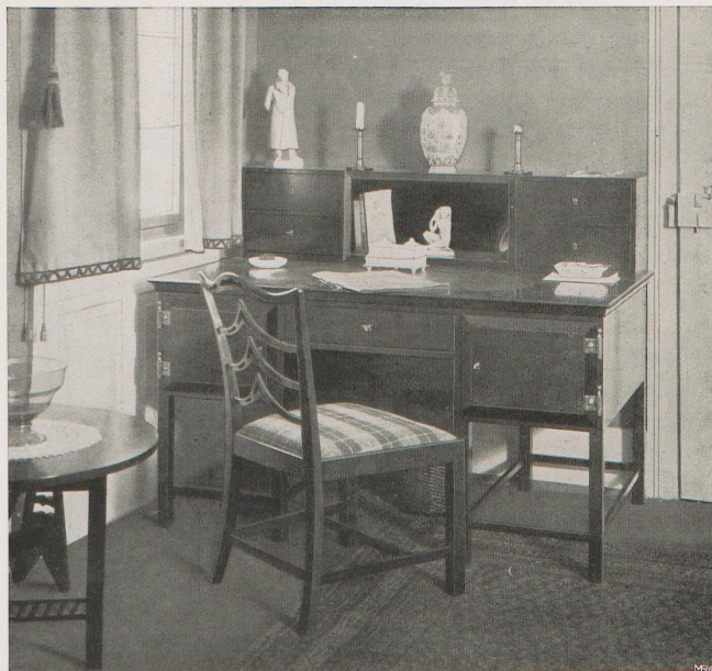
ERWIN BEHR-WENDLINGEN. KLEINER SCHREIBTISCH