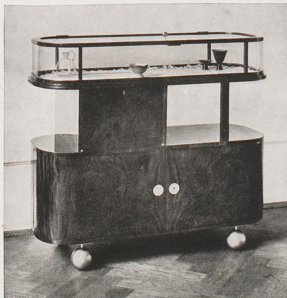
ARCHITEKT RUDOLF LUTZ-STUTTGART. VITRINEN-KASTEN IN EINEM EMPFANGSRAUM

auch nichts ganz und gar nichtssagend, tot oder hoffnungslos. Nur der Brennpunkt des Interesses ist verschoben. Das Gepränge der bestehenden Einrichtungen und Zeremonien, die das glücklich Erreichte feiern sollen, sieht man dann als das, was es ist, — durch seinen faden-scheinigen Glanz leuchten jene Dinge hindurch, welche die Zukunft gestalten werden. . . . H. G. WELLS