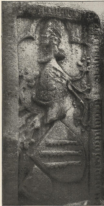
Abb. 83 Offenhausen, Kirche, Grabstein v. Speth