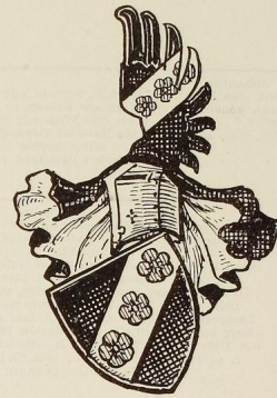
Rau von Winnenden.