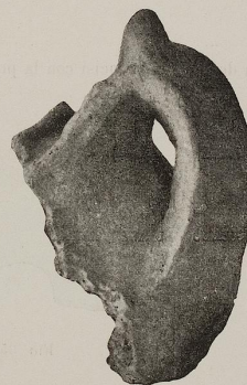
Fig. 32. 2:3

dimentali ora più sviluppate; più o meno arrovesciata indietro; talvolta infine accoppiata con piccola ansa