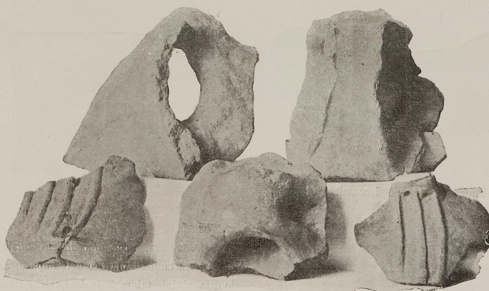
Fig. 29. 2:3

ad anello verticale, che attaccandosele dietro nella parte inferiore prende appoggio sulla parete del vaso.