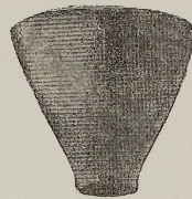
Fig. 70 a, b. 1:1

Un disco forato, per pendaglio, diametro nella fig. 66; una fusaiola nella fig. 67. Un grosso anello con fori