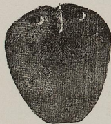
Fig. 69 a. 1:1

L'unico oggetto conservato di questa materia è rappresentato dalla piccola ascia a margini rialzati