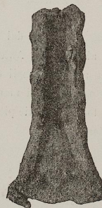
Fig. 71. 5:6

viene riprodotto nella fig. 68; i forami, dei quali è munito, me lo fanno giudicare pendaglio. Oggetti si-