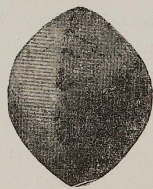
Fig. 67. 1:1

mili a quello di corno cervino qui riprodotto a fig. 65, e che giudicherei teste d'aghi crinali, anche in im-