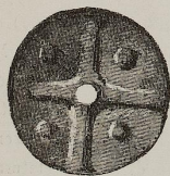
Fig. 69 b. 1:1

viene riprodotto nella fig. 68; i forami, dei quali è munito, me lo fanno giudicare pendaglio. Oggetti si-