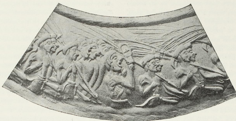
FIG. 3. — Vaso di H. Triada. Gruppo centrale del bassorilievo.

col sinistro, che però è invisibile), mentre volge in su verso il medesimo la faccia, gridando a bocca spalancata. La posizione non conviene che ad una persona caduta o genuflessa od anche in qualsiasi modo accovacciata.