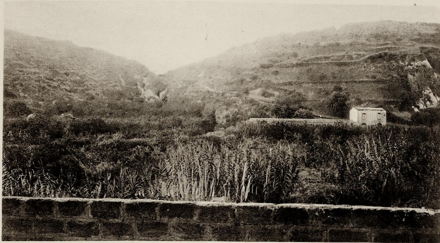
VALLETTA IMERESE VISTA DALLA FERROVIA