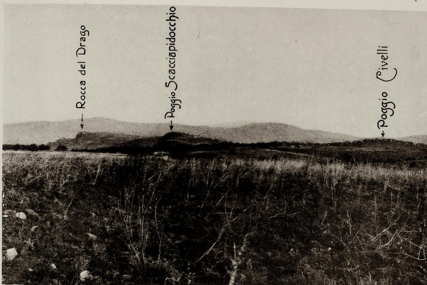
VEDUTA GENERALE DELL' ALTIPIANO D' IMERA