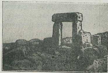
Θύρα πύργου Μυκόνου.

τροχοῦ πεποιημένα, ἰδίως ἐν πύργῳ, ἔνθα δὲν ὑπῆρχε δεξαμενὴ ὕδατος, οὐδὲ πηγὴ τις πλησίον. Ἡλὴν τούτων ἀνευρέθησαν τεμάχια ἀγγείου χρώματος φαιοῦ, βαρέος, κακοτέχνως κατασκευ-