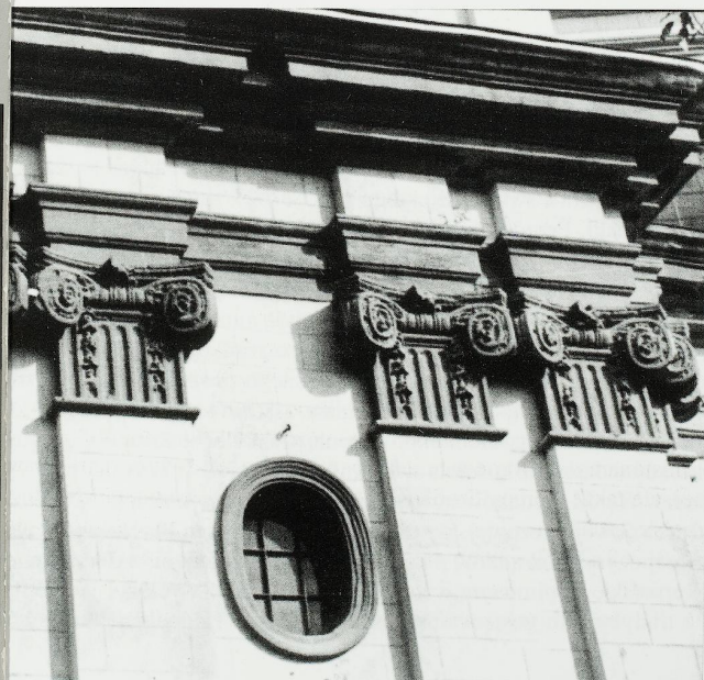
nikanów, 1749–1770, architekt ks. Paweł Giżycki, kapitele na elewacji bocznej.