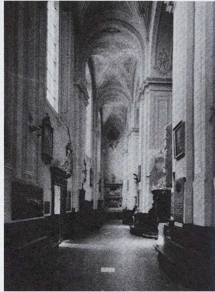
7. Przemysł, katedra. Wnętrze nawy południowej.